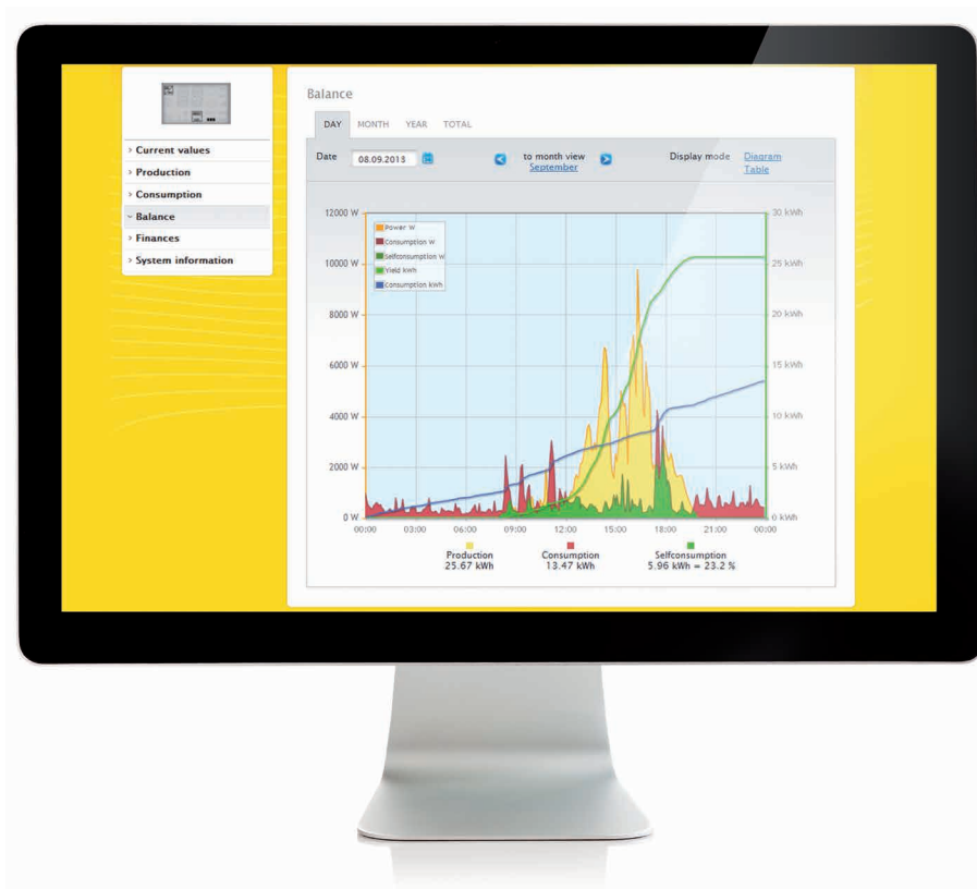
Il "Bilancio" mette in relazione la produzione e il consumo dell'impianto fotovoltaico